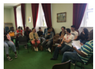
Visualizzazione dei documentari e discussione alla tavola rotonda al Seminario RefugeesIN di giugno.

Anche i partner irlandesi si stanno preparando anche per il loro evento moltiplicatore/conferenza nazionale ad Ottobre. Si terrà nel Centro di Dublino il 14 Ottobre presso il Centro Africano. Stiamo lavorando con i nostri colleghi di Cultur ed altri per questo sforzo.