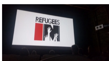
RefugeesIN-Logo, so anders im Dunkeln und auf einer großen Filmfestival-Leinwand in Portorož.