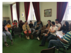
Schauen Sie sich die Dokumentarfilme und den runden Tisch beim RefugeesIN-Seminar im Juni an.

Die irischen Partner bereiten sich im Oktober auch auf ihre nationale Multiplikatoren-/Konferenz vor. Sie findet am 14. Oktober im African Centre in Dublin City Centre statt. Wir arbeiten bei diesem Vorhaben mit unseren Kollegen von Cultur und anderen zusammen.